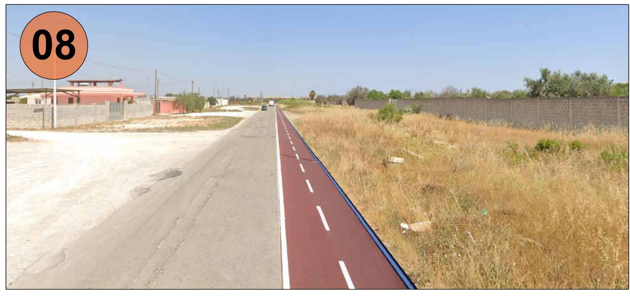
Via Appia Antica